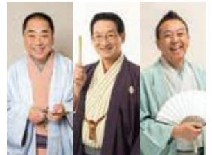
三遊亭好楽 春風亭昇太 林家たい平

4月2日(日) 開演 13:30 レイホックホール RaiBoC Hall(市民会館おのみや) 大ホール ☎048-641-6131 (9:00~19:00)