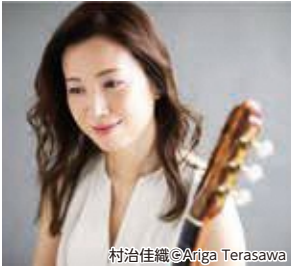
村治佳織

国内外で活躍するギタリスト村治佳織がプレミアムクラシックに登場します!クラシックギターの魅力をご堪能ください。 【演奏予定曲】花は咲く、ティアーズ・イン・ヘブン、人生のメリーゴーランド 他