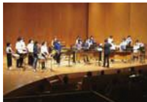
写真は昨年度の公演

プロのアーティストが公募により集まった子どもたちと打楽器バンドのコンサートを行います。