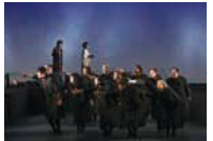
写真は昨年度の公演

ブラザースで立ち上げ活動を行っている「劇団Liebe (リーベ)」が芥川龍之介原作「杜子春」をベースにした新作公演を行います。