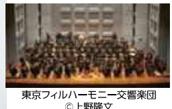
東京フィルハーモニー交響楽団