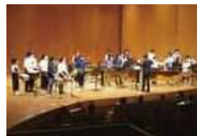
写真は昨年度の公演

プロのアーティストが公募により集まった子どもたちと打楽器バンドのコンサートをを行います。