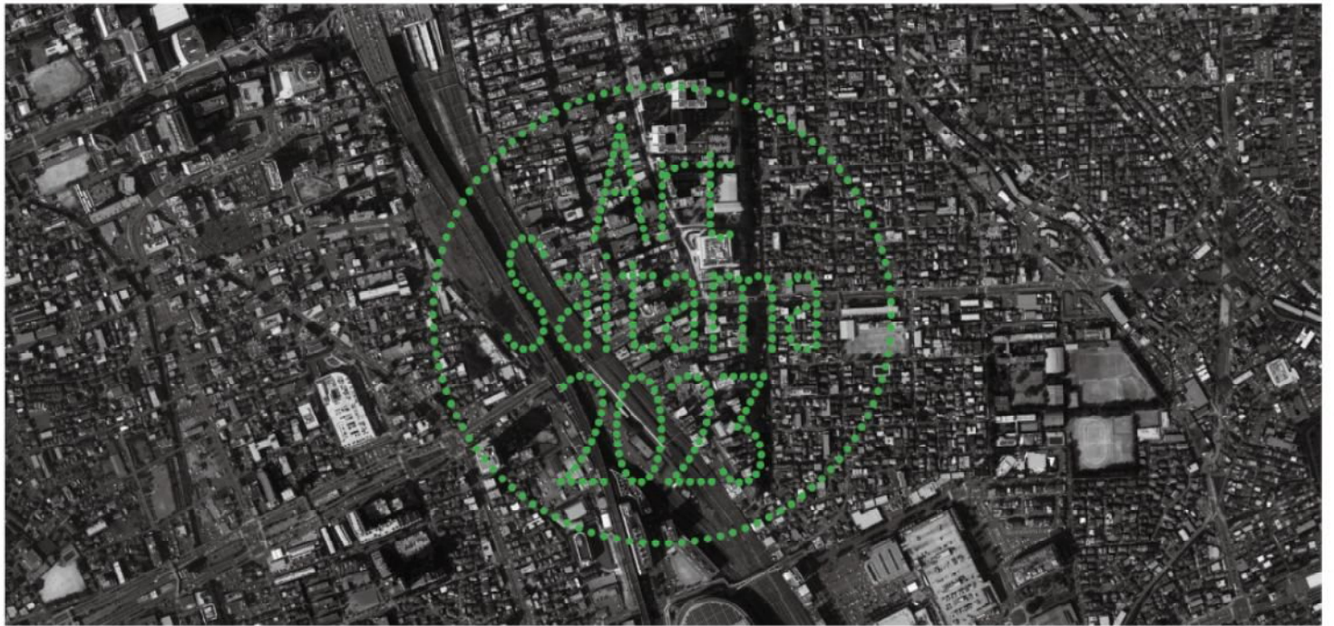
【航空写真】 【オリジナル フレーム切手写真】 ※「フレーム切手」は日本郵便株式会社の登録商標です。