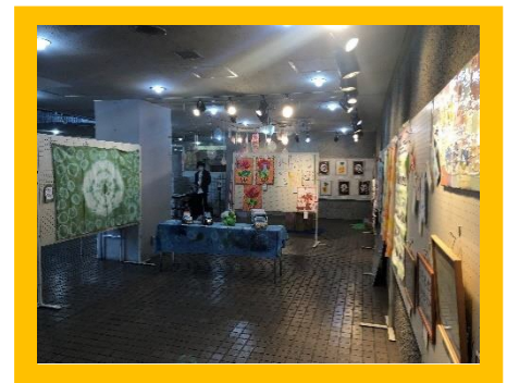
昨年度のコミュニティセンターいわつきの様子