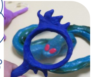
槻の木利用者作品

さいたま市内の障害者施設3か所を自主運営、14か所を指定管理者として運営している「社会福祉法人さいたま市社会福祉事業団」では、障害のある方々の表現活動を支援するためにアート支援プロジェクトを立ち上げ、今年度はさいたま市内を3ブロックに分け、会場展示とホームページでのWEB展示のハイブリット開催を企画しました。絵画や書道、立体作品など障害のある方々が心を込めて制作した作品が多数展示されています。お気軽に足を運んでいただきたいと思います。