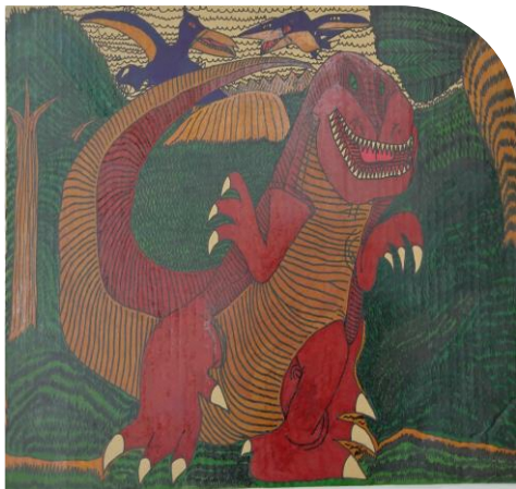
日進職業センター利用者作品