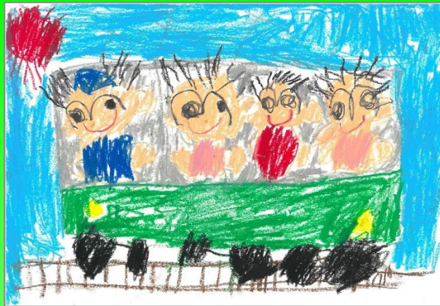
これらのイラストは昨年度の最優秀作品です