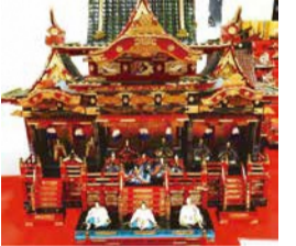
江戸から昭和の人形展