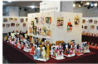
小学生創作ひな人形展