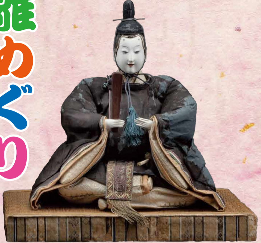
古今雛 江戸時代 さいたま市岩槻人形博物館蔵