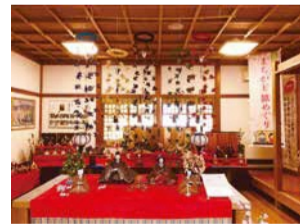
つるし雛と老舗のコラボ