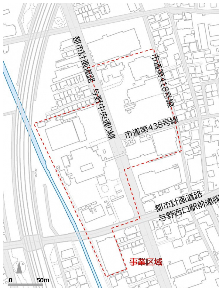
図 2 事業区域全体図