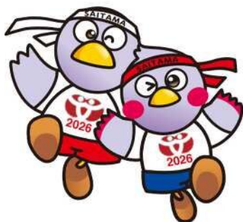
コバトン&さいたまっち