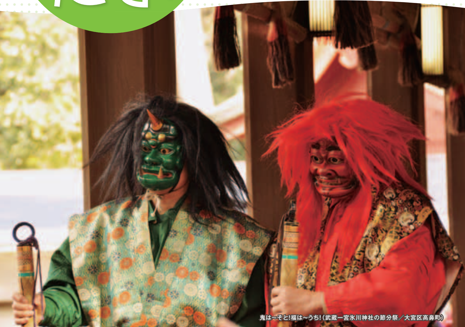
鬼は~そと!福は~うち!(武蔵一宮氷川神社の節分祭/大宮区高鼻町)