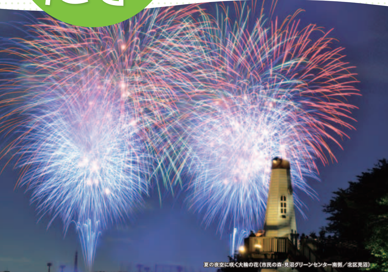
夏の夜空に咲く大輪の花(市民の森・見沼グリーンセンター南側/北区見沼)