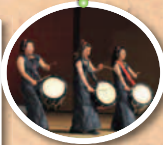
▲ゲストの「批魅鼓」による迫力ある和太鼓演奏も披露されました