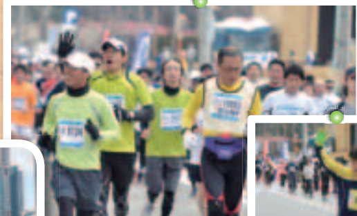
▲沿道の応援にランナーが笑顔でこたえます