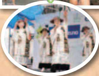
▲福島県双葉町の皆さんによる「相馬流れ山踊」が披露されました