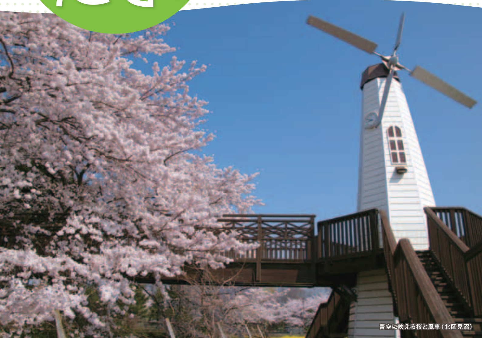
青空に映える桜と風車(北区見沼)