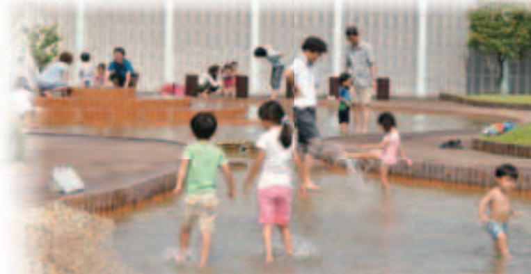
水とやすらぎの広場(大宮配水場内)

公園のシンボルでもあるサギのモニュメントの下が階段状の滝になっていて、水遊びができます。また、予