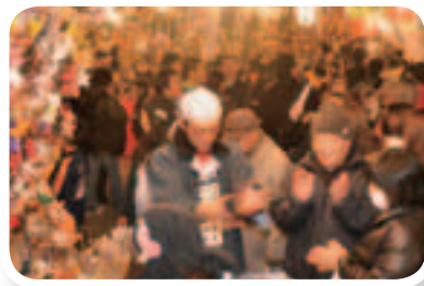
▲縁起物の熊手を求める 多くの人でにぎわいました