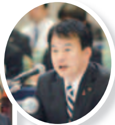
▲進行役を務める 清水市長