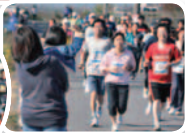
▲沿道の声援が疲れたランナーの励みになります