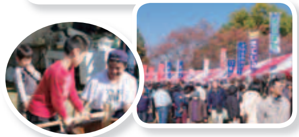
▲秋晴れの中、多くの人でにぎわいました