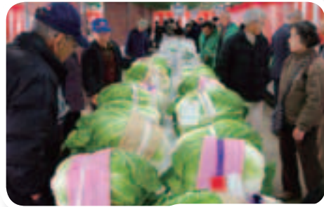
◀品評会に出品された白菜、どれも見事な出来栄です