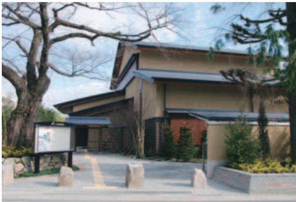
大宮盆栽美術館(北区土呂町)