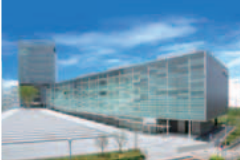
昨年8月にさいたま新都心に移転した「タマリオン株式会社」の新社屋(中央区)

さいたま市では、産業が集積するまちづくりをめざして、企業誘致を行っています。活動方針は「まもり、まねいて、そだてます」。まず、市内企業を活性化し、さらに市外の企業にも働きかけて、本社や研究所などを市内に開設する企業を増やしています。用地やビルの情報を提供するほか、充実した補助金制度やビジネス支援制度も活用して、市を拠点に活動する企業の発展を支えています。