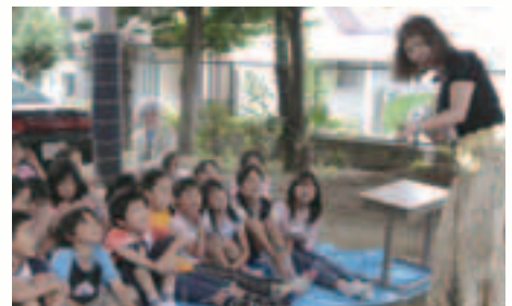
学校図書館の運営には、保護者や団体などもボランティアで加わっています。写真:文蔵小学校(南区)

「司書の配置」と併せて「コンピュータを全校に導入」し、司書が蔵書を入力してデータベース化しています。全校分を合わせて約140万冊のデータ化された蔵書数は、日本一の冊数です。検索すれば、どこかの学校に何冊あるか把握でき、週2回の「ネットワーク便」(トラックが運行)で届けてもらうことができます。また、市立図書館から100冊単位で借りることもできます。