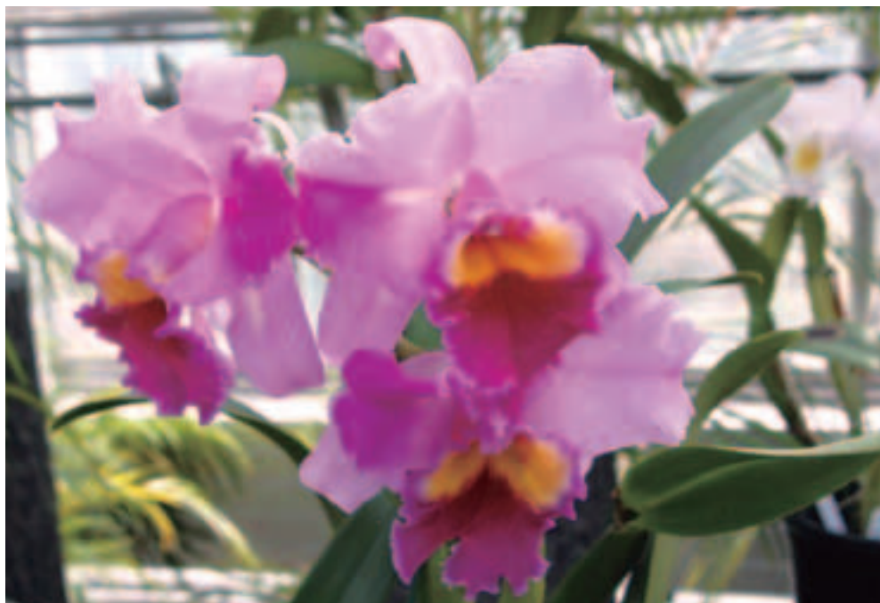
色鮮やかに咲く洋らん(園芸植物園)