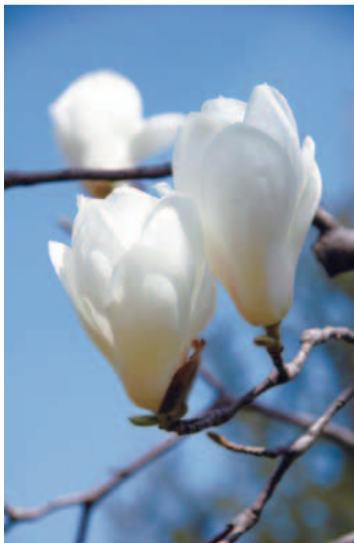
のどけき春(ハクモクレン)