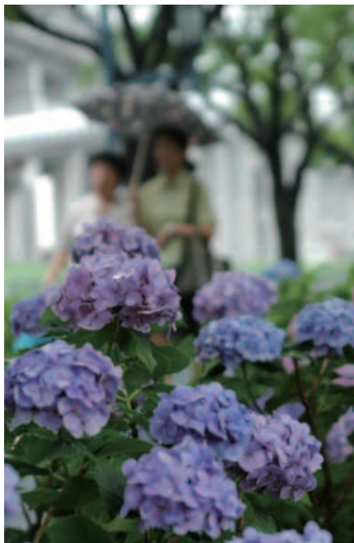
梅雨を彩るあじさい(花と緑の散歩道・南区別所)