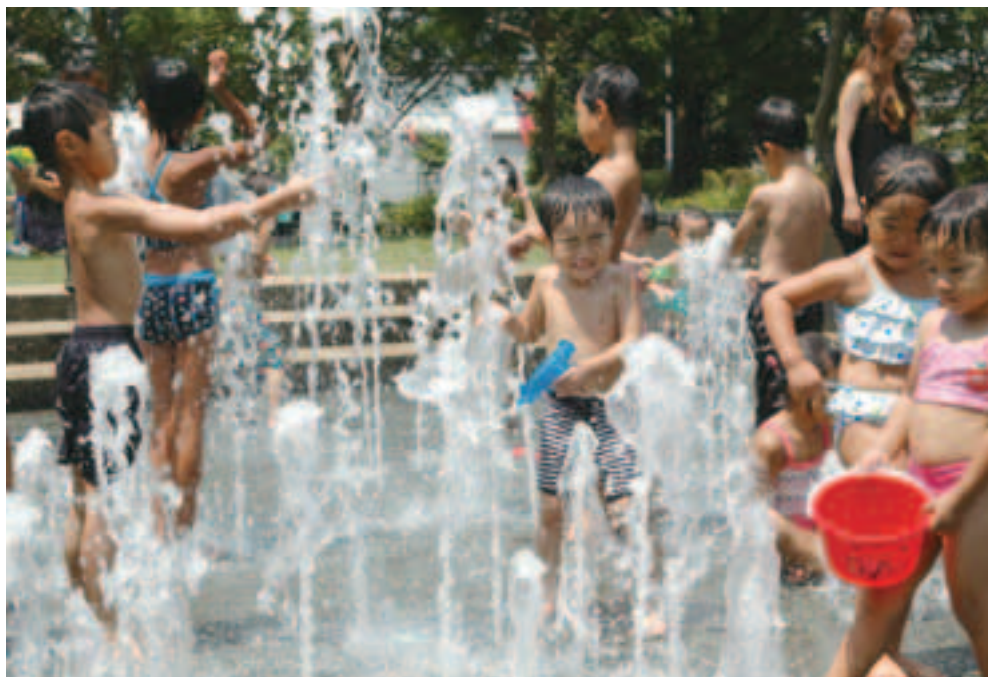
夏空の下に響く歓声(埼玉スタジアム2002 水の広場)