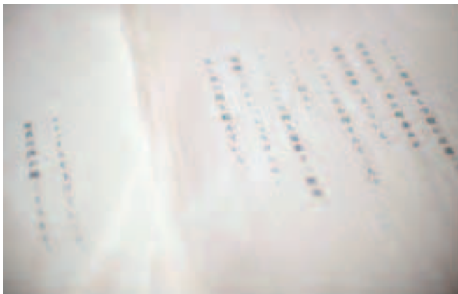
芥川賞作家の新作を展示します ②