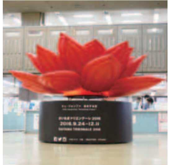
風景を一変させる存在感! ⑧ アーティスト:チェ・ジョンファ 会場:彩の国さいたま芸術劇場