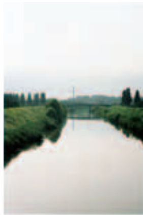
トリエンナーレのキービジュアル ⑩ アーティスト:野口里佳 会場:旧部長公舎