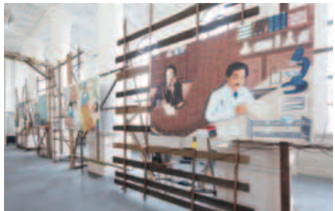
歴史上の人物を題材にした物語 ③