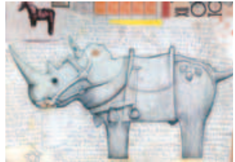
架空のさいたま市から出土するものは? ①