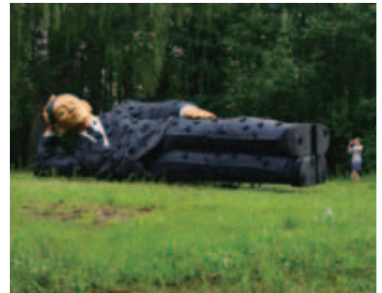
約10メートルの巨大なビジネスマンが現れる ⑪ アーティスト:アイガルス・ピクシェ 会場:西南さくら公園(南区鹿手袋)