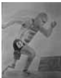
▲昨年度の最優秀賞作品「義足のランナー」

テーマ 障害のある方とない方との心のふれあいの体験 対象 市内在住で、小学生以上の方 応募規定 ▼400字詰原稿用紙(B4判又はA4判縦書き)を使用 ▼小・中学生は2～4枚程度、高校生以上の方は4～6枚程度 ▼題は自由 ▼未発表のもの 障害者週間のポスター