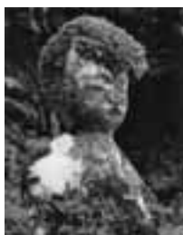
▲昨年度の最優秀賞作品 「パンチパーマ」

応募規定 ▼最小(127mm×178mm)～最大(254mm×305mm)のサイズにプリントしたもの(2L、キャビネ、六ツ切、A4、四ツ切など) ▼白黒カラーは不問 ▼未発表のもの ▼1人5点以内 ※被写体が人物や著作物の場合は、承諾を得た作品に限ります。