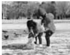
▲昨年度の金賞作品 「出来た一帽子もかぶせて!!」