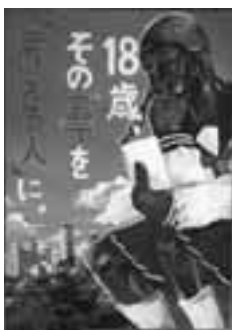
▲昨年度の入選作品