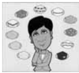
▲昨年の大賞受賞作 「小池都知事 マスクコレクション」

テーマ 健康 ※自由作品も受け付けます。 応募規定 ▼はがきサイズ以上A3判以下 ▼1枚で完結する 賞金 ▼ジュニア：図書カード