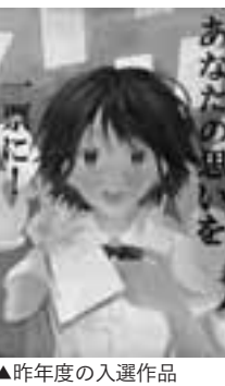
▲昨年度の入選作品