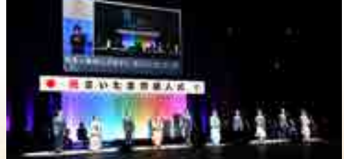
▲過去の式典の様子

参加方法 事前登録が必要です。詳しくは、12月上旬に発送する案内状をご覧ください。