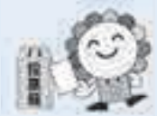
さいたま市選挙キャラクター

本市では、皆さんが選挙で安心して投票できるよう、さまざまな取り組みを行っています。