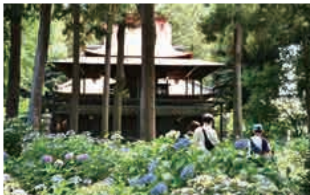
▲さまざまな種類のアジサイが見頃を迎え、来場者に癒やしを与えていました