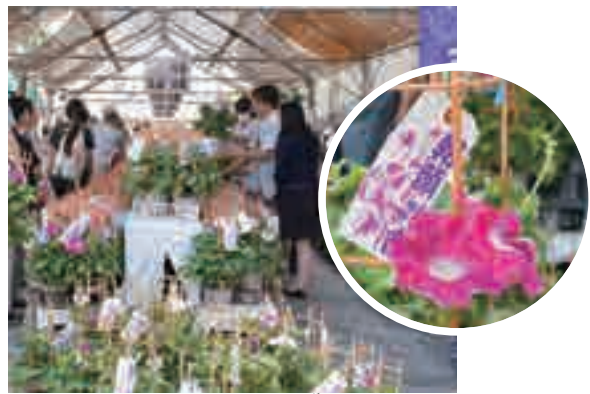
▲朝顔を求める多くの来場者で賑わいました