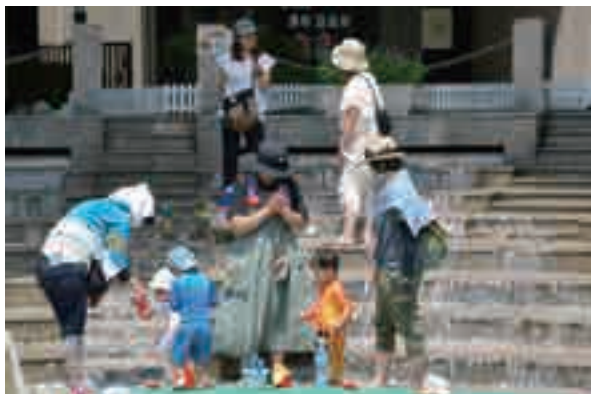
▲涼を楽しむため、多くの親子連れが水遊びに興じました