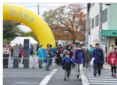
さいたまマーチの様子

さいたま新都心から見沼たんぼ周辺を歩く「第1回さいたまマーチ〜見沼ソーデウォーク」が昨