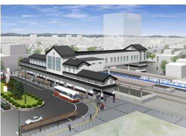
岩槻駅完成イメージ図