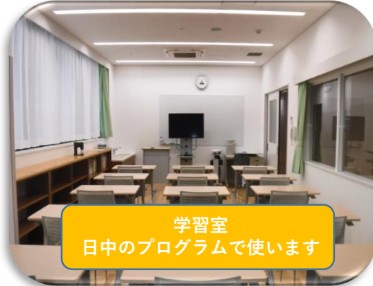
学習室 日中のプログラムで使います