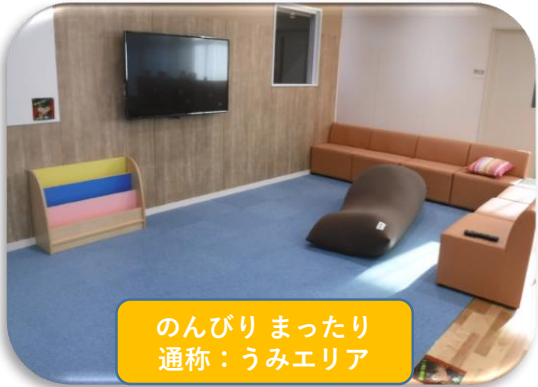
のんびりゆったり 通称：うみエリア