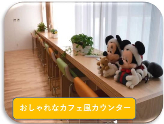
おしゃれなカフェ風カウンター