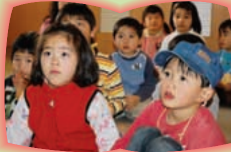
▲目を輝かせて聞いている子どもたち