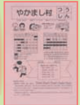
▲やかまし村つうしん