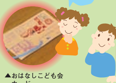
▲おはなしこども会カード