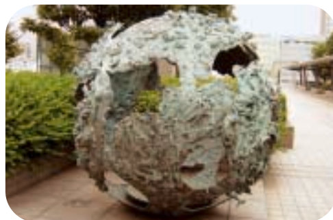
子どもたち300人による作品(ほしにすむ)