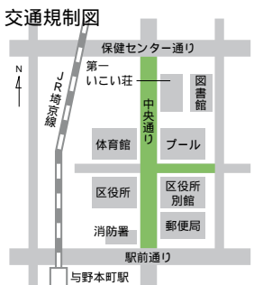
交通規制図 規制時間 11月22日(土)・23日(日)9時~16時