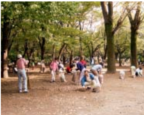
さわやかな汗をかきました