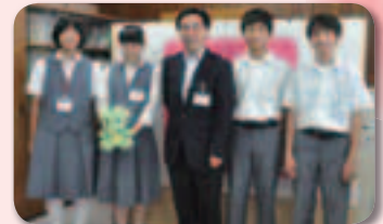
▲7月8日(水) 未来くるワーク 八王子中学校2年生のみなさんと