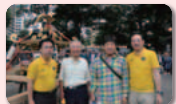
▲7月18日(土) 与野夏祭りにて