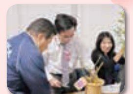
▲11月19日(土) バラの手入れ講習会

今年も1月3日に、七福神に扮した市民等による「与野七福神仮装パレード」が行われます。与野七福神は、昭和60年頃、地元有志の発意により、7寺社が選ばれ誕生しました。現在の与野七福神は、北から氷川神社(福祿寿)、一山神社(恵比寿神)、天祖神社(寿老人)、御嶽神社(弁財天)、円乗院(大黒天)、円福寺(布袋尊)、鈴谷大堂(毘沙門天)に祀られており、仮装パレードは、本町通りの北に位置する氷川神社を起点に出発し、最後の鈴谷大堂までを練り歩く、距離にして3.5キロメートルほどの短い距離の中にあり、手軽に巡ることができます。