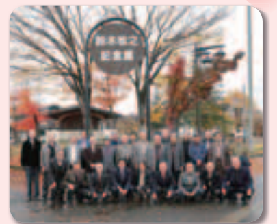
▲自治会連合会会長研修 (新潟県南魚沼市)