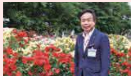
▲与野公園にて(昨年)

「ばらまつり」は、昭和55年に始まり今年で42年目を迎えます。会場の与野公園で、今を盛りに咲き誇る約180種類・3,000株のバラを是非お楽しみください。また、令和4年度「さいたま市中央区のまちづくり」を策定しました。区の将来像「歴史と文化の調和のとれた都市の創造と交流(ふれあい)が育てる安心なまち」の実現に向け、区民の皆様が心の豊かさを実感できる安心・安全・快適なまちづくりの推進に、引き続き取り組んでまいりますのでどうぞよろしくお願いたします。