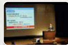
写真は昨年度の様子です。

今年度は、新型コロナウイルス感染症予防対策として事前申込み制とさせていただきます。入場時に手指消毒、検温、マスク着用のご協力をお願いいたします。参加希望者は、事前に下記問合せ先までご連絡ください。