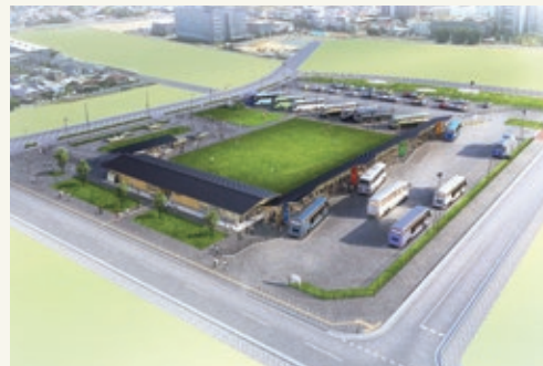
さいたま新都心バスターミナル(イメージ図)

市民の利便性の向上および交通結節機能の強化のため、大宮区北袋町1丁目にバスターミナルを来年6月に設置するための条例案が可決されました。同施設には、バスターミナルのほか、一般車駐車場(56台分)およびバス駐車場(15台分)が設置される予定で、本年10月からバス駐車場が先行して供用開始されます。