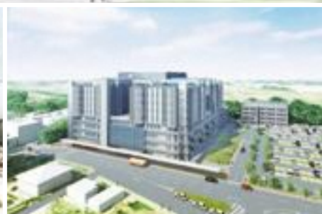
外観イメージ図(遠景)