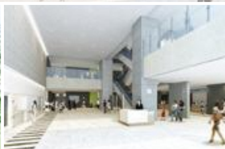
エントランスイメージ