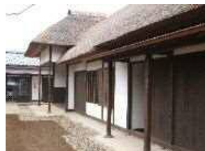
岩槻藩遷喬館 岩槻区本町 4-8-9