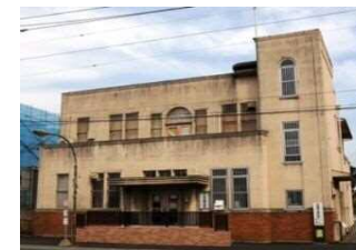
岩槻郷土資料館 岩槻区本町 2-2-34