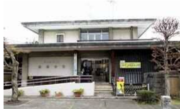
さいたま市立漫画会館 北区盆栽町 150

大正 12 年の関東大震災を契機に、東京の盆栽業者が、広い土地や新鮮な水と空気を求めて移り住んできたことで誕生した大宮盆栽村。盆栽の聖地として、世界中から盆栽愛好家が訪れます。