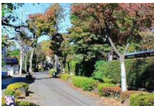
大宮盆栽村 北区盆栽町周辺