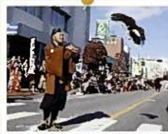
城下町岩槻鷹狩り行列

地元の達人を講師とした親子で楽しく健康づくりを考える教室を4回実施し、参加者の満足度80%を目指します。