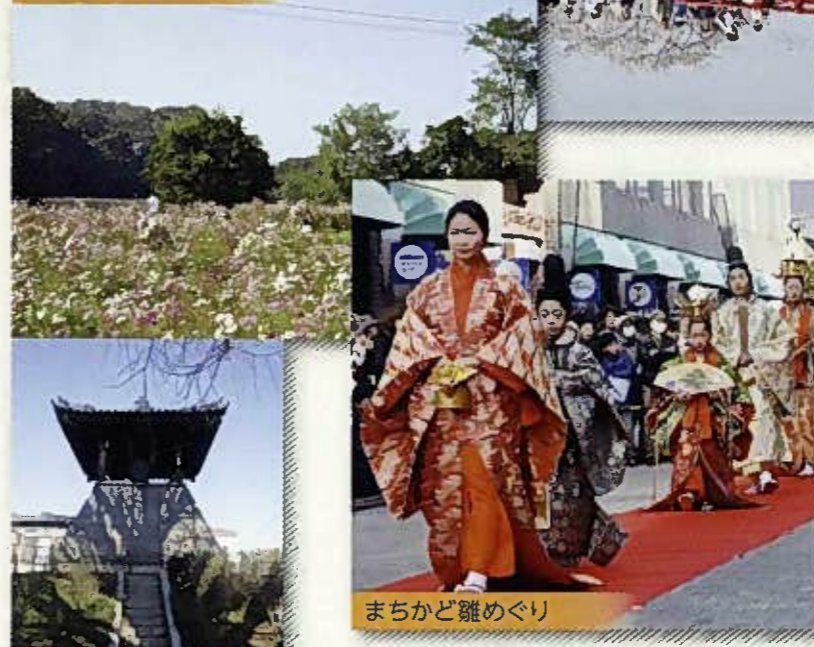
まちかど雛めぐり