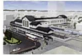
岩槻駅舎（東口）完成イメージ図

岩槻駅周辺の活性化と利便性向上及び駅のバリアフリー化を図るため、駅舎の橋上化及び東西自由通路の整備を行います。また、岩槻駅西口の開設に合わせ、駅前広場、それに接続する都市計画道路等の整備を行い、商業の活性化と潤いのある住環境の形成を図ります。