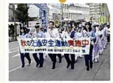
秋の全国交通安全運動