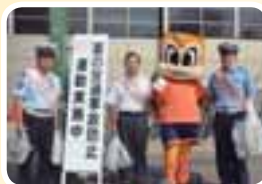
夏の交通事故防止運動にて

残暑の厳しい日が続いていますが、朝晩は、少しずつ秋の気配を感じる季節になってきました。皆さんいかがお過ごしでしょうか。