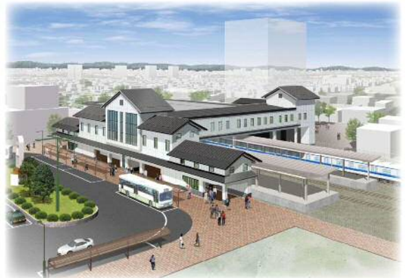
岩槻駅舎完成イメージ

このように、区民の声がきちんと行政に届けられ、岩槻区民と行政による協働のまちづくりが進められています。