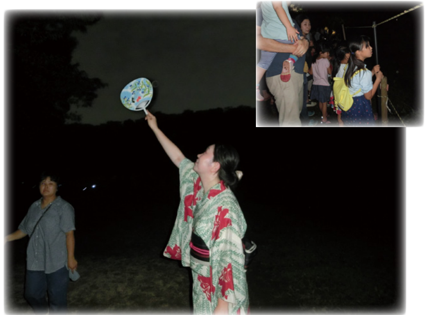
7月18日、19日 岩槻城址公園

「来年も見られるといいね。」と言いながら、手を繋ぎ、帰る親子連れの姿が、なんとも微笑ましかったです。