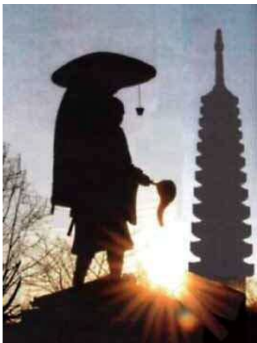
朝日を浴びる玄奘三蔵法師像イメージ(慈恩寺)

被災地からは、お互いに助け合いながら、復興に向けて歩む人々の姿が報道されました。ここ岩槻区でも、人と人のつながり・絆をさらに深めるための取り組みが芽生えています。