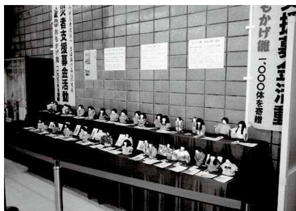
被災地への発送前に、旧区役所ロビーにて「おもかげ雛」を展示しました