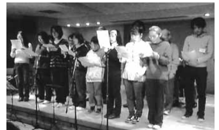
東口コミセンでの合唱会

当団体は子ども、高齢の方、障害のある方の福祉施設で、音楽やイベントを企画し、自己表現の楽しさや希望、自己の可能性の追求を提案していきます。さいたま市が制定した「ノーマライゼーション条例」に基づき、「障害者も健常者もみんな一緒なのだよ」と提言をしていきます。当団体の趣旨にご賛同・活動して下さるタレント、マジシャンも募集中です。