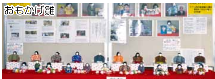
展示団体：NPO法人ためぞうクラブ