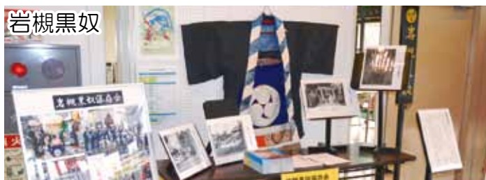
展示団体：岩槻黒奴保存会

市民活動ネットワークは行政と協働・支援で皆さんの幅広い活動を後押ししていきたいと考えています。岩槻区内で市民活動されている方は、登録団体として一緒に手を取り合っ