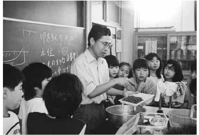
総合学習での一コマ

るタベ」という2本立てになっております。飼育して、一番の感動は、ひかり始めるのを見るときです。ものすごく感動します。この感動を体験してみませんか。