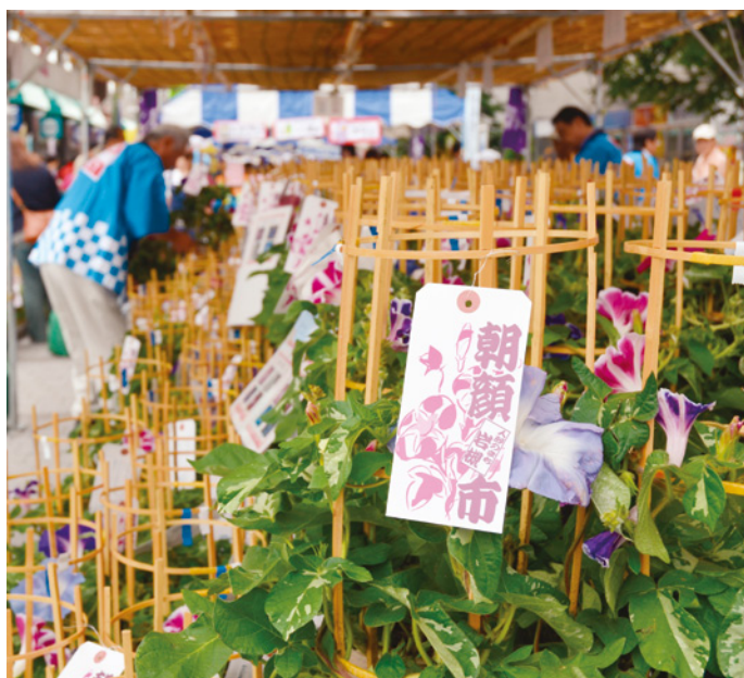
朝顔市は毎年7月の第1日曜日に岩槻駅前のクレセントモールで開催されます。今年は7月1日に開催され、朝顔約560鉢が完売となりました。

このように、人形のまち岩槻の朝顔市には、岩槻市民活動ネットワーク登録団体がそれぞれの持ち味を活かして参画しています。どなたも気軽に参加できる、素敵な事例です。