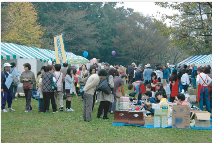
▲来場者で賑わう「つどいの広場」 ※今回の会場レイアウトは6ページをご覧ください。

今月、10月27日(日)には岩槻文化公園で「第9回岩槻区民やまぶきまつり」が行われます。