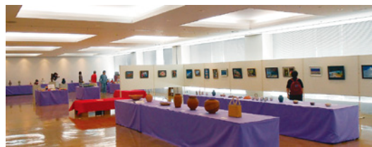
◀ 昨年のアート作品展示会場風景