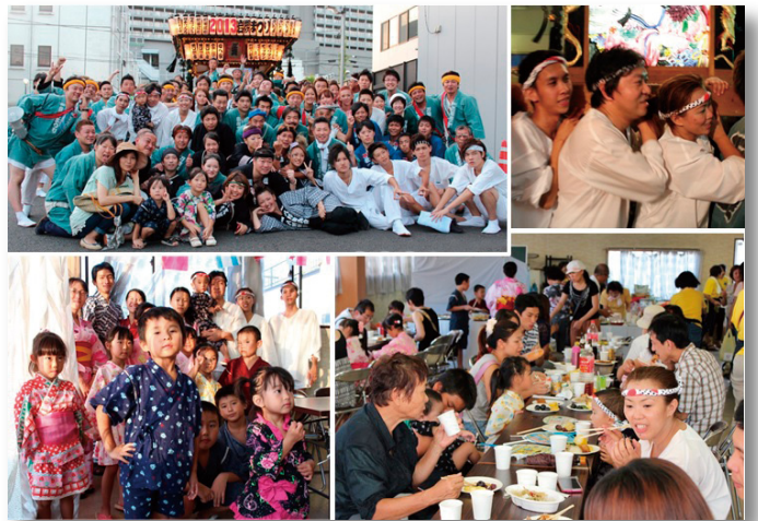
▲浴衣やみこしを体験し広がる国際交流

とボランティアも含め約90人が集まり、各国の自慢料理を味わいながら国際交流を楽しんでいました。