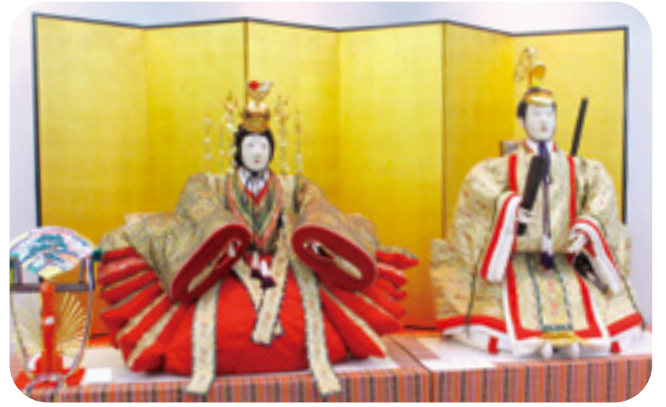
珍しい等身大の大きな人形（享保雛）も展示されました。