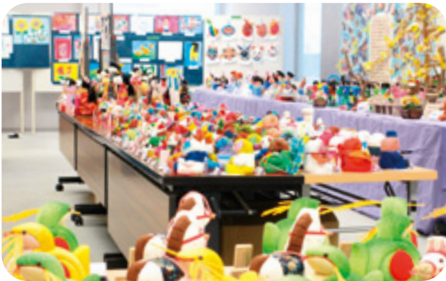
小・中学校の作品展示。 幼稚園～大学まで沢山の参加がありました。