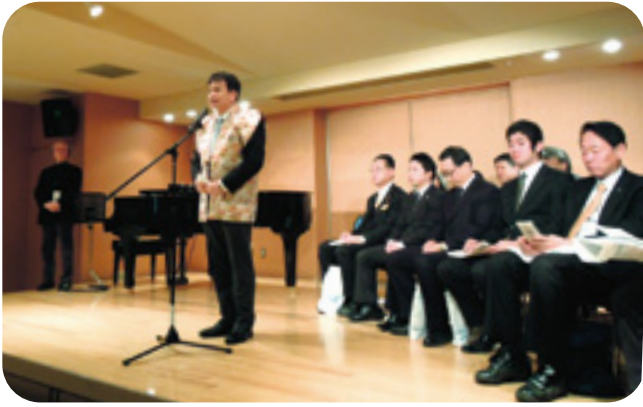
大雪のため、室内でのオープニングセレモニー。 清水勇人さいたま市長にご挨拶をいただきました。