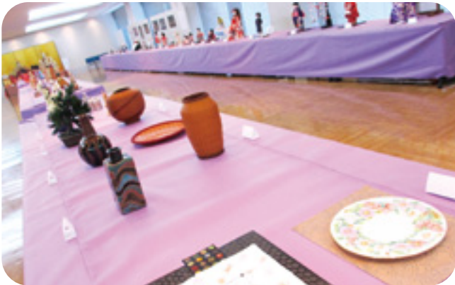
3F 立体アート展示会場。様々な力作が並びました。