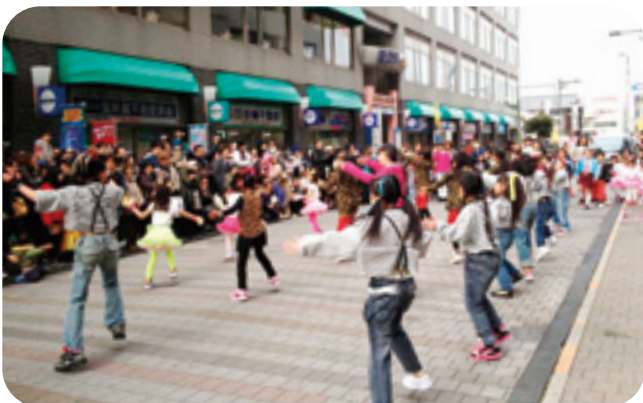
屋外会場でのストリートパフォーマンス。 元気いっぱい盛り上がりました。