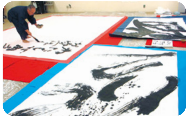
書道LIVE会場。迫力満点でした。