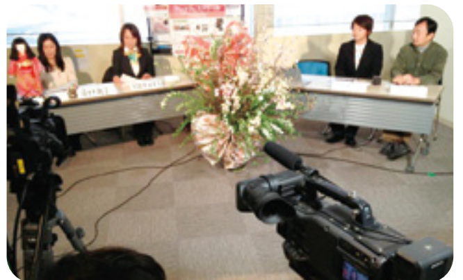
Ustream（ユーストリーム）生配信スタジオ。 アートフェスティバルを全世界に発信しました。