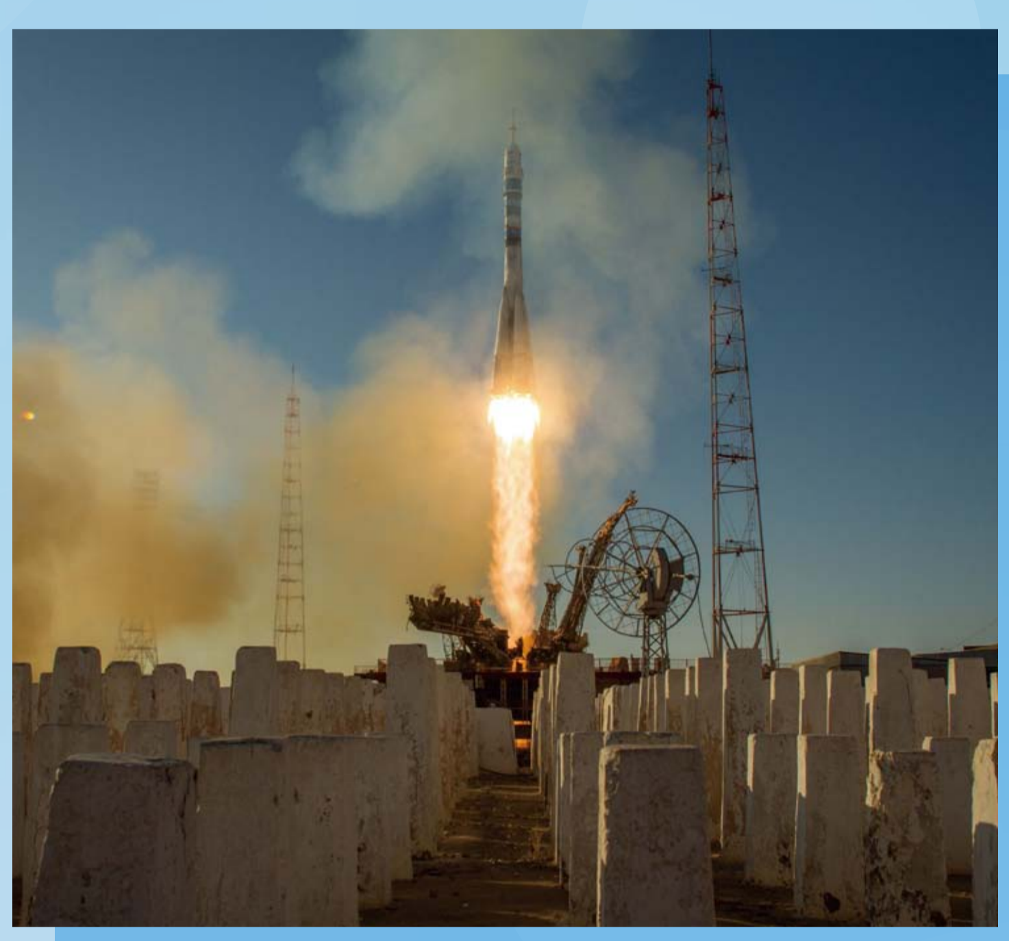
ソユーズロケット打ち上げ