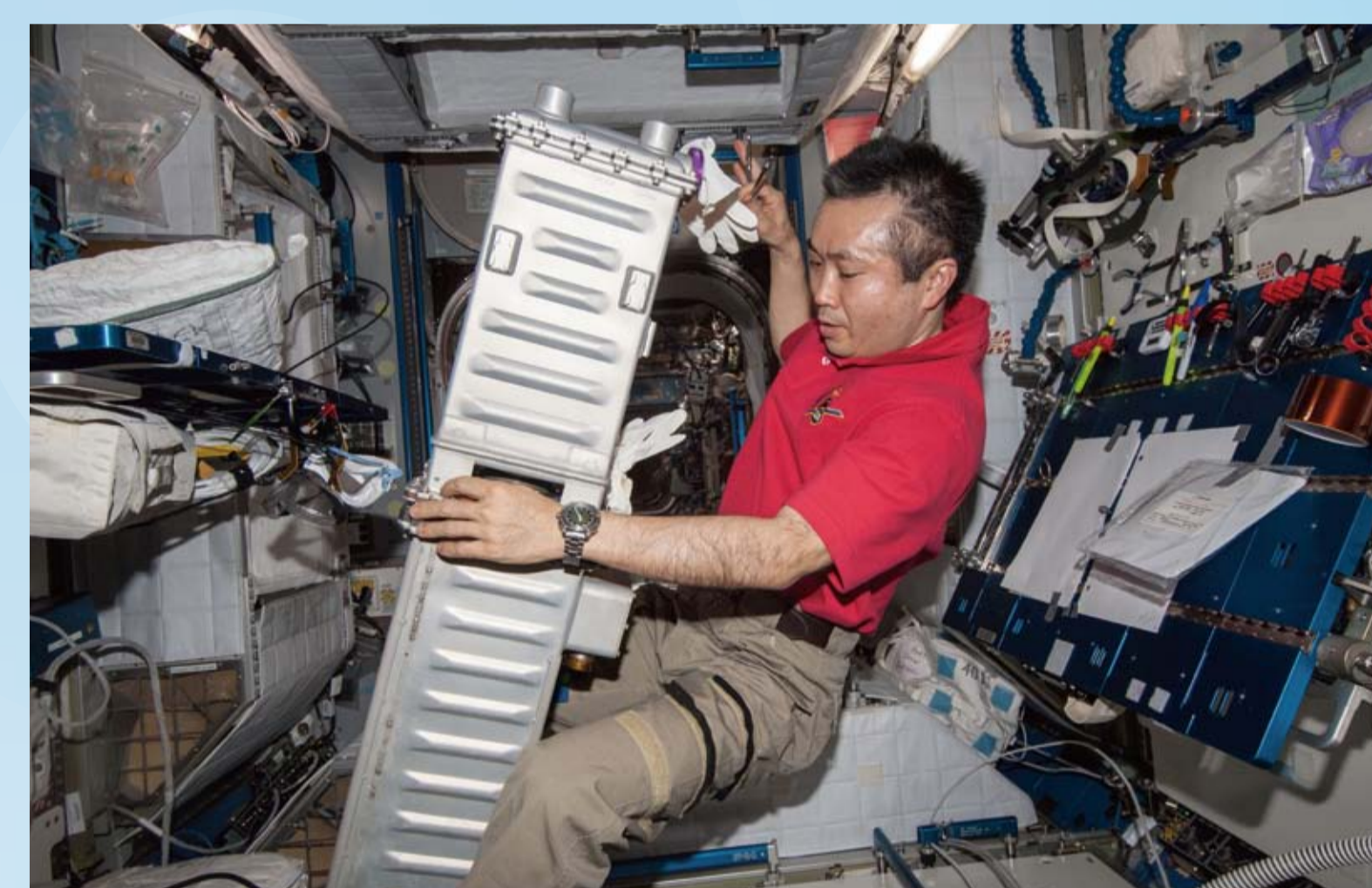
二酸化炭素除去装置(CDRA)のメンテナンス