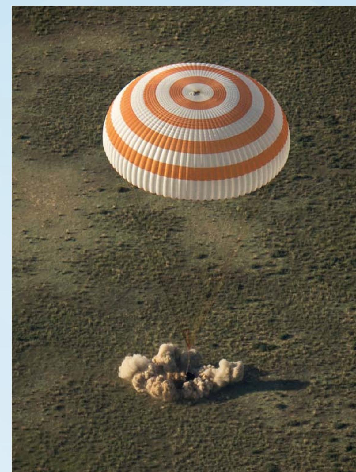
ソユーズ宇宙船着陸