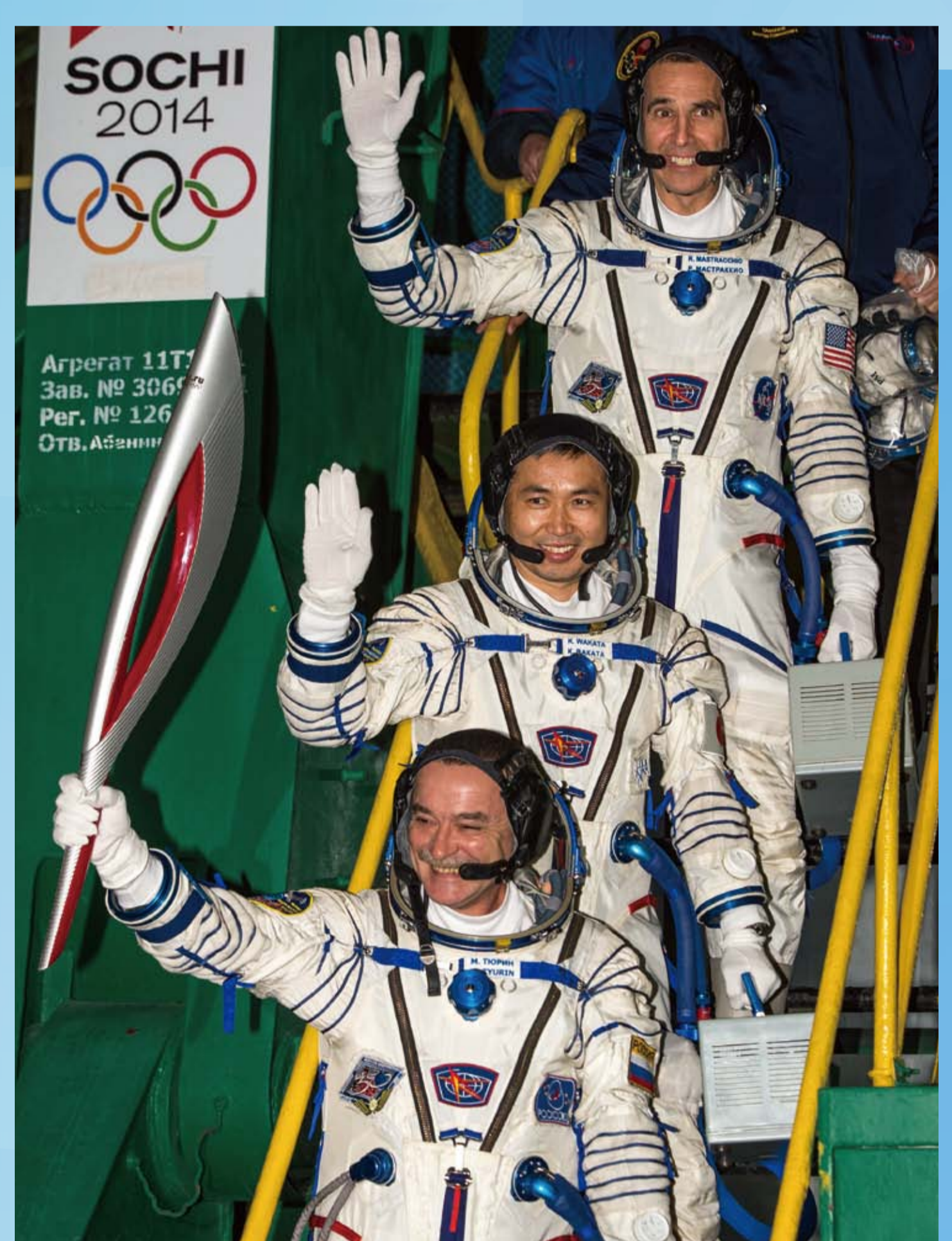
ソユーズロケット搭乗