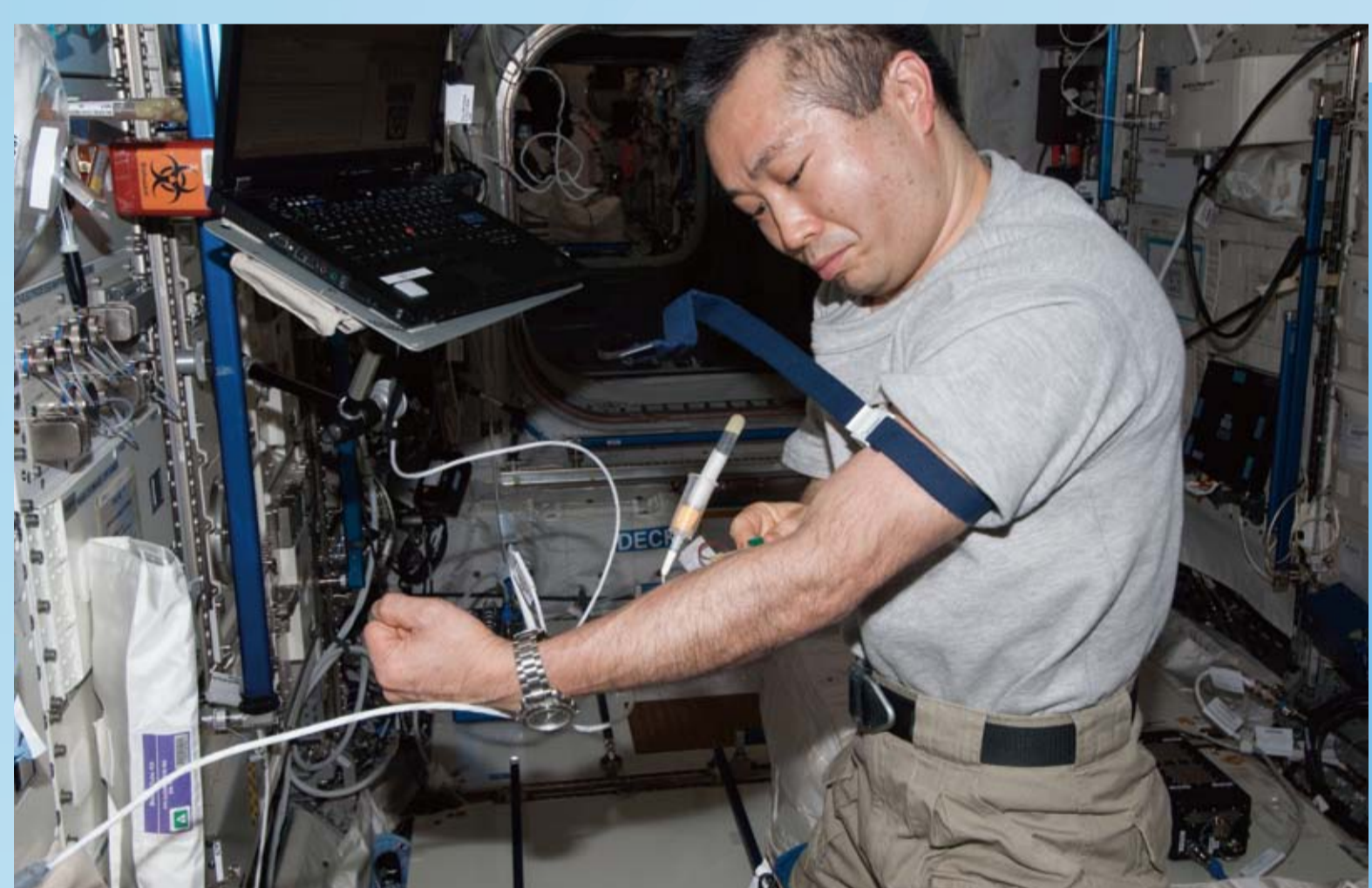
「コロンバス」(欧州実験棟)にて自身の採血