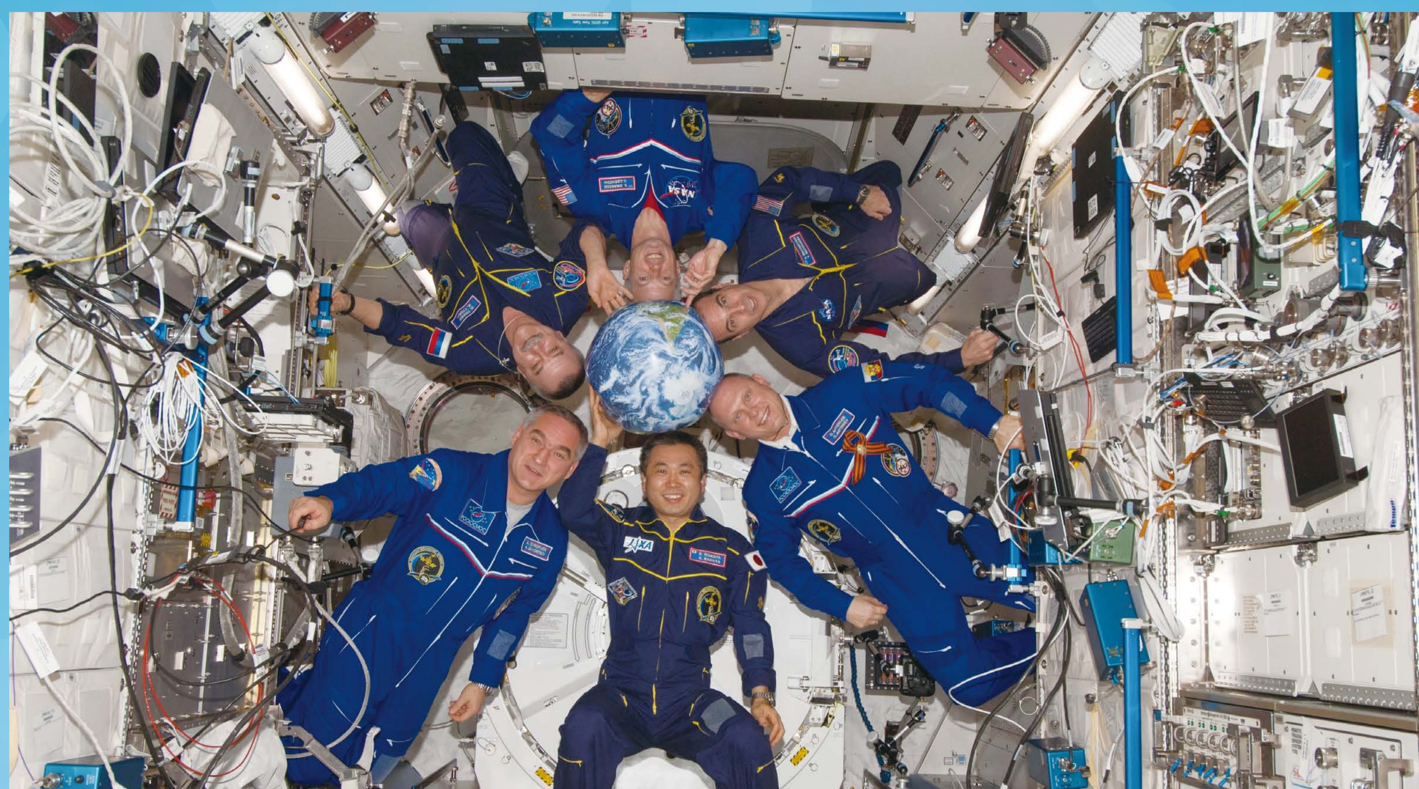
若田宇宙飛行士がコマンダーを務めた第39次長期滞在クルー