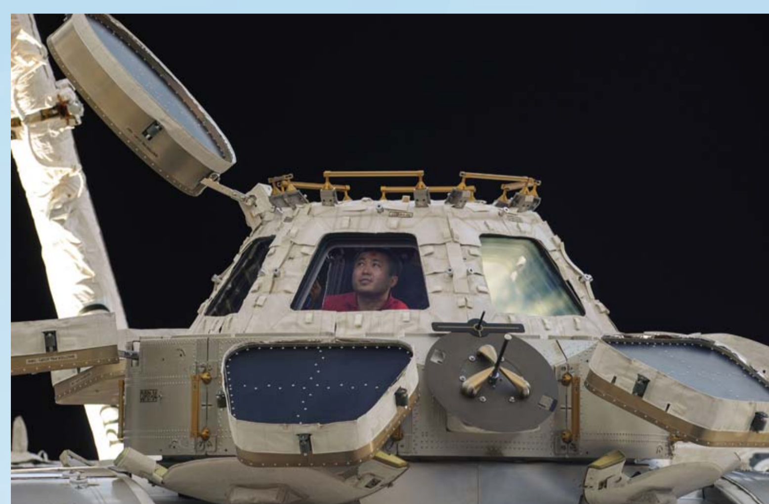
キューポラから船外を眺める