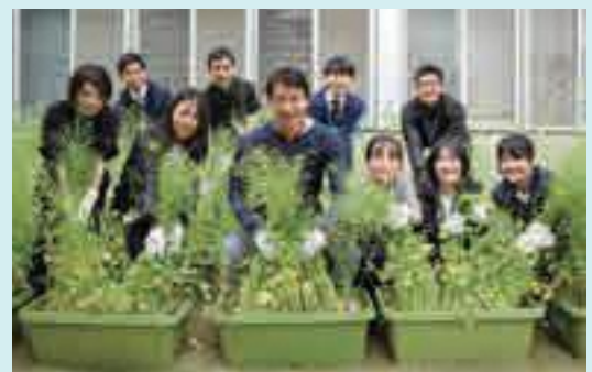
若い力を結集して、来年も立派な菜の花を咲かせます